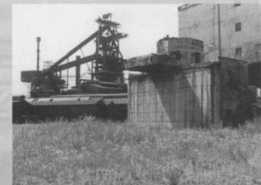
Momentaufnahme im Juli 1997: Vier Jahre nach der endgültigen Schließung Blick auf das Hüttengelände mit Hochofen 1