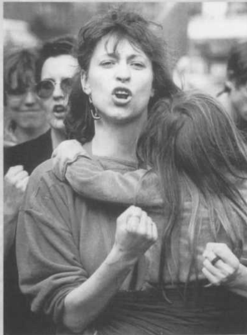
Keiner schiebt uns weg! Solidaritätsfest „Rheinhausen ist überall“ (16.4.88)