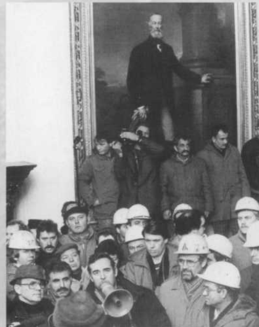
König Alfred Krupp und „seine“ Arbeiter