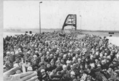
Kundgebung auf der „Brücke der Solidarität“ am 20. Januar 1988

Stahlaktionstag: Über 100 000 Menschen beteiligen sich an spontanen Aktionen: Bauern und Stahlarbeiter, Bergleute und Studentinnen