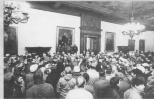
Sturm auf Villa Hügel (9.12.87)

Rückzug der deutschen Truppen aus Rheinhausen